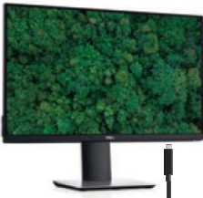
DP HDMI USB-C