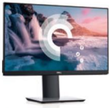
DP HDMI VGA