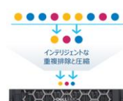
常時稼働インラインデータ削減