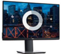
DP HDMI VGA