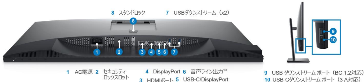
1 AC電源 2 セキュリティ ロックスロット 3 HDMIポート 4 DisplayPort 5 USB-C/DisplayPort 6 音声ライン出力 10 7 USBダウンストリーム (x2)