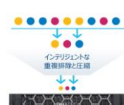
常時稼働インラインデータ削減