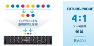
常時稼働インラインデータ削減