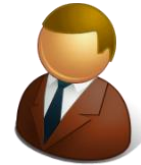
貴社の 営業チーム