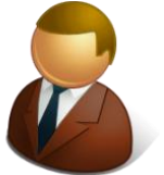
貴社の 営業担当様