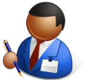
ディストリビュー ター営業担当様